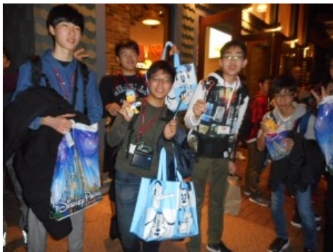
ディズニースプリングにてお買い物