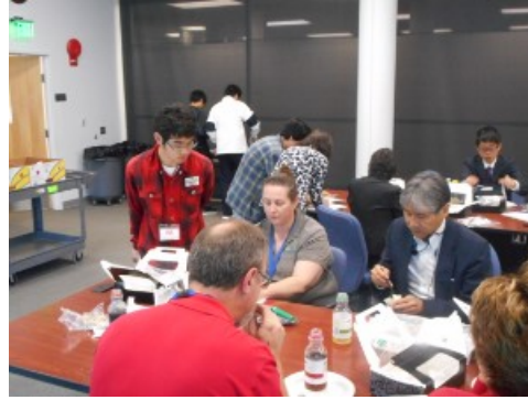
質問はランチ中も続きます