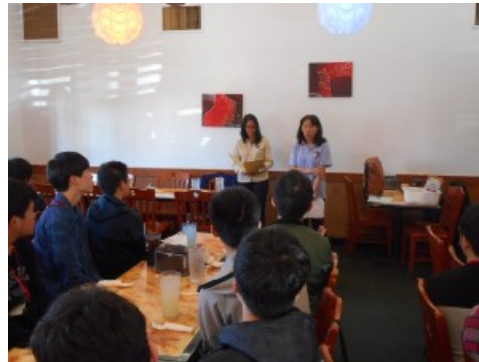
現役スタッフをお迎えして夕食