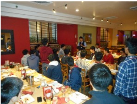
朝のミーティング