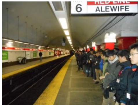
地下鉄にも慣れました