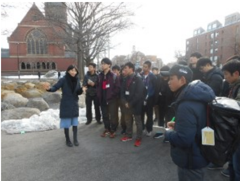
ハーバードキャンパス