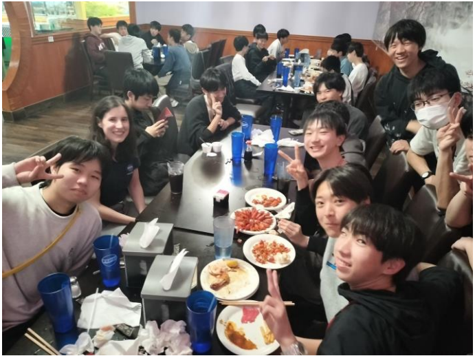
アメリカでの最後の夕食です