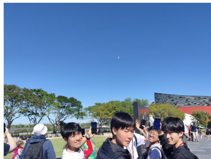
ロケット打ち上げを見ることができました