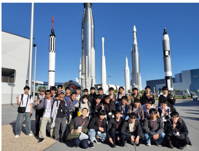
ケネディスペースセンター

いよいよ明日は日本に向けて帰国となります。生徒達もボストン、オーランドで様々な事を体験し、それぞれ成長していることと思われます。