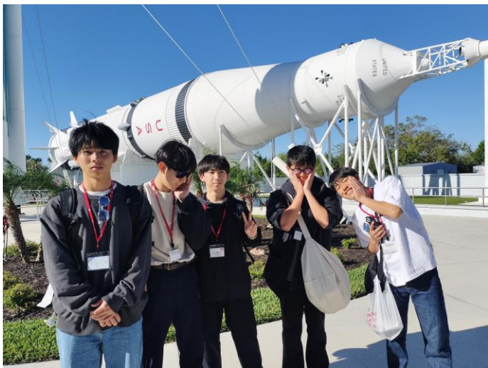
行動を共にした仲間たち 1班