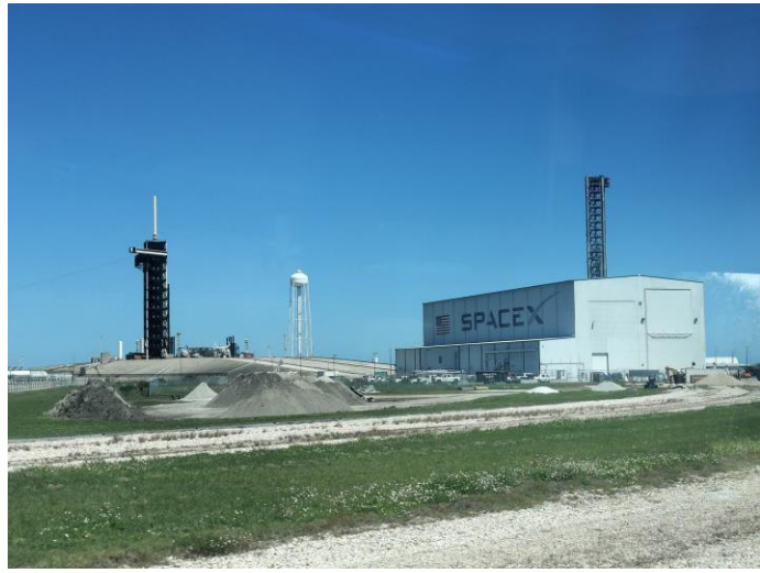
SPACE X社のロケット打ち上げ基地