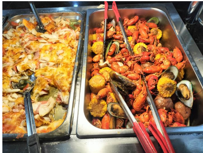
夕食バイキングにはアメリカの郷土料理ザリガニもありました