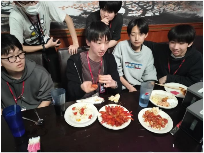
一人でザリガニ二何匹食べたの？