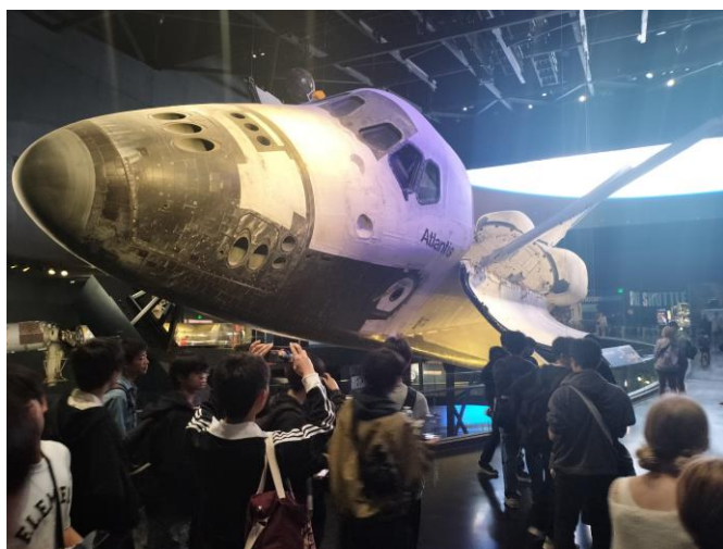
スペースシャトル アトランティス号