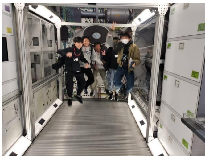
シャトル内 無重力なのかな？ 浮いてる！