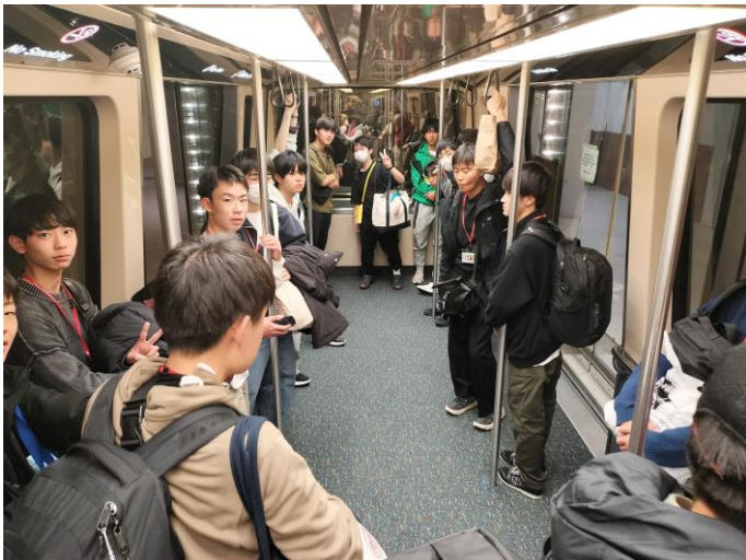
オーランド空港ターミナル間のシャトルトレイン乗車