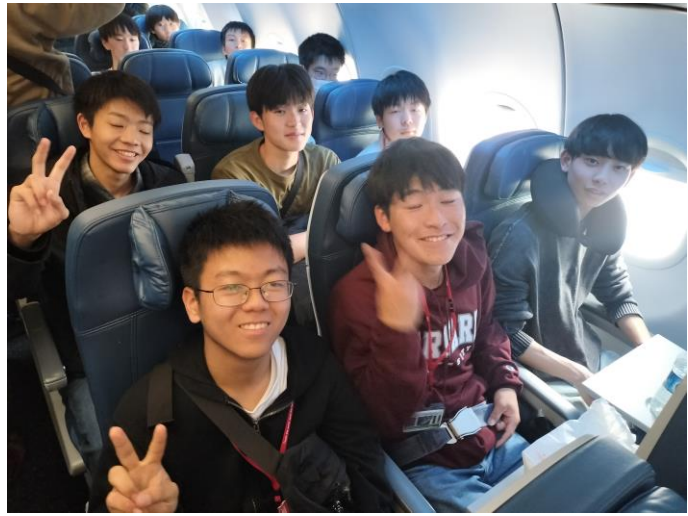
オーランドへ向けて出発します