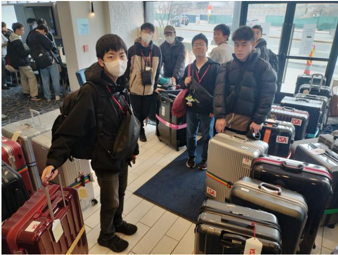
ボストンのホテルを出発します

色々ありましたが22時にオーランド空港をバスで出発、10分程でホテルに到着 本日の夕食は各部屋でのお弁当となり22時半には全員部屋に入り解散となりました。