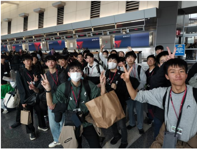
ボストン空港 チェックインが終了しました