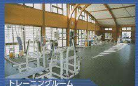
トレーニングルーム